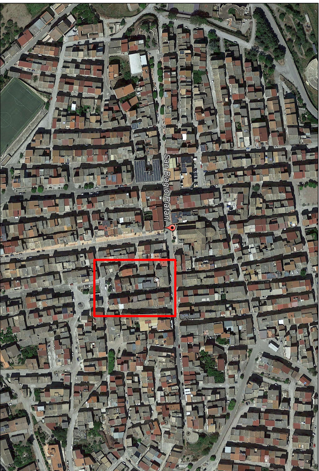
Oriafoto (Localizzazione intervento)