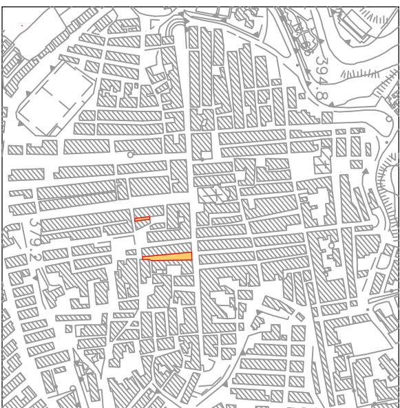
Piantina Generale Scala 1:2.500